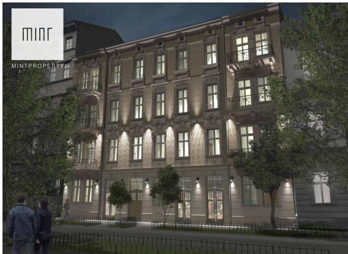
Wizualizacja elewacji frontowej budynku głównego nocą *